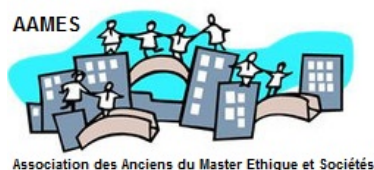
Association des Anciens du Master Ethique et Sociétés

L'objectif de l'AAMES est de rassembler les personnes qui sont ou ont été impliquées dans le Master d'éthique et sociétés : anciens étudiants, étudiants en cours de formation, les membres du personnel, les