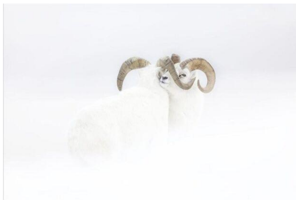
Mouflons de Dall

C'est avec constance et humilité que l'affut dans le gel porte ses fruits, tout d'un coup l'animal s'invite dans le champ du photographe, dans toute sa noblesse, l'appareil saisit alors un regard qui ne cherche ni à duper, ni à attirer. Beauté gratuite d'un instant fragile signant une présence mystérieuse puis l'animal s'efface de l'écran en silence. Les artistes le savent, le sauvage vous regarde sans que vous le perceviez et disparaît quand le regard de l'homme l'a saisi (S. Tesson). Notre sens du sacré, du divin vient de la beauté de ces photos qui nous émeuvent par leur énigmatique splendeur, nous émerveillent, nous subjuguent. L'œil de l'artiste nous a transmis cette beauté qui émane des animaux