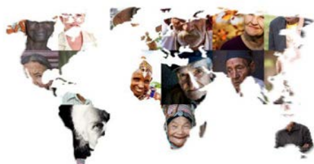
SOCIÉTÉ INCLUSIVE ET AVANCÉE EN ÂGE

Appel à communications 6 ème Colloque international du Réseau d'Études International sur l'Âge, la Citoyenneté et l'Intégration Socio-économique (REIACTIS) – Société inclusive et avancée en âge, 4-5-6 février 2020, Metz Congrès Robert Schuman