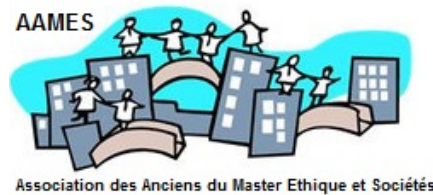
Association des Anciens du Master Ethique et Sociétés

L'objectif de l'AAMES est de rassembler les personnes qui sont ou ont été impliquées dans le Master d'éthique : anciens étudiants, étudiants en cours de formation, les membres du personnel, les intervenants, ainsi que toutes les personnes qui se sentent liées de près ou de loin au CEERE.