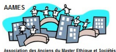
Association des Anciens du Master Ethique et Sociétés

L'objectif de l'AAMES est de rassembler les personnes qui sont ou ont été impliquées dans le Master d'éthique et sociétés : anciens étudiants, étudiants en cours de formation, les