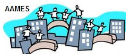
Association des Anciens du Master Ethique et Sociétés

L'objectif de l'AAMES est de rassembler les personnes qui sont ou ont été impliquées dans le Master d'éthique : anciens étudiants, étudiants en cours de formation, les membres du personnel, les intervenants, ainsi que toutes les personnes qui se sentent liées de près ou de loin au CEERE.